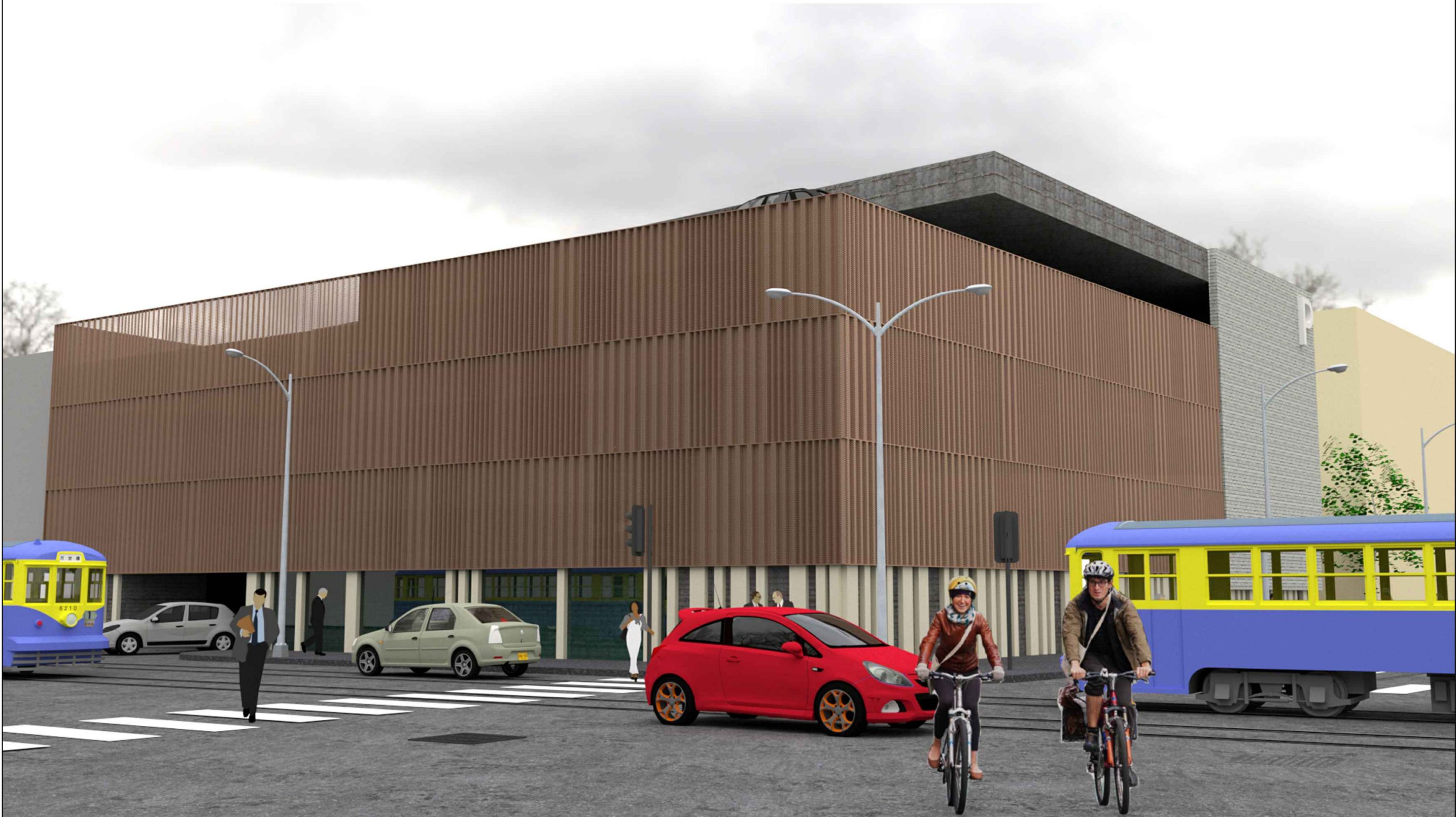
Vedere dinspre Nord (intersecție str. Griviței / str. George Coșbuc)